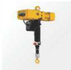
Talha Ergonômica Manolift