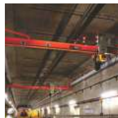
Ferroviário ( Railway )