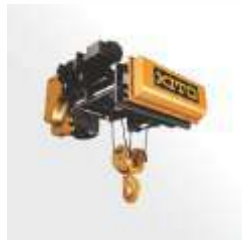
Talha Elétrica. Cabo/Corrente